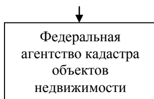
Рис. 1. Система контрольно-надзорных органов государственной власти в сфере земельных ресурсов

Цели ГЗН в РФ и РК представлены на рис. 2 [3, 4].