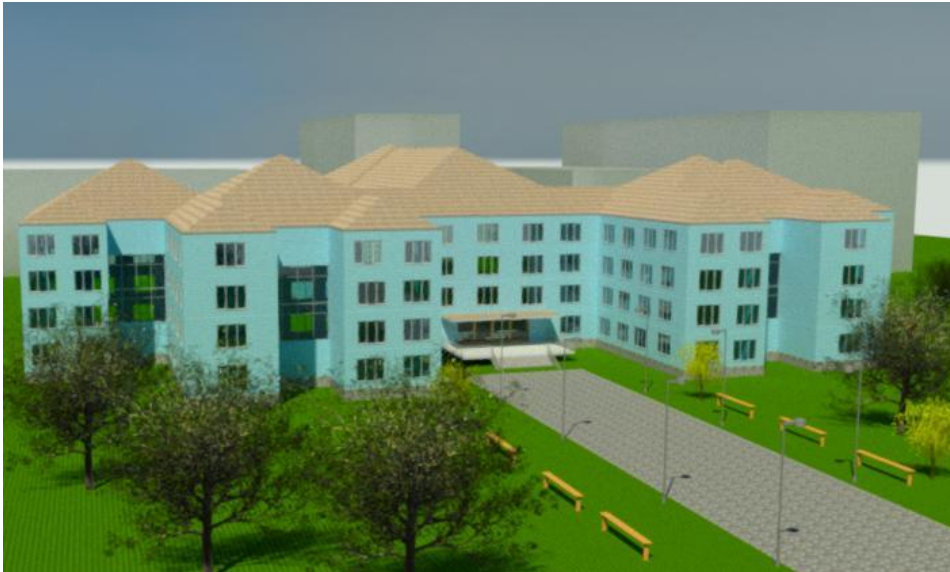
Рис. 2. Визуализация образовательного учреждения

топоповерхности в строгом соответствии с планом окружающей территории (Рис. 2)