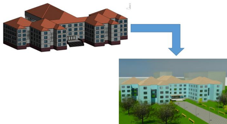
Рис. 3. Образовательное учреждение до и после визуализации

Моделируя объект на разных стадиях, мы можем анализировать несколько вариантов возможных архитектурных и планировочных решений, одновременно сопоставляя с существующими для разработки наиболее оптимального варианта проекта реконструкции (Рис.3).