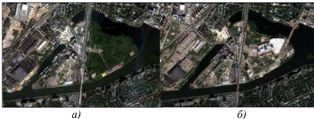
Рис. 2. Парк развлечений «Остров мечты» на снимках Sentinel-2: а) 18.09.2015, б) 28.08.2019

проводилась с помощью инструмента LayerStacking. На рис.2 представлены снимки Sentinel-2 на разные даты в «натуральных» цветах.