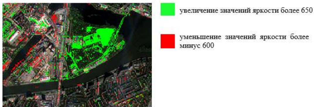
Рис. 4. Результаты выявления изменений между датами 18.09.2015 и 28.08.2019 методом, основанным на использовании индексных изображений

После выполнения преобразований изображений, полученных на разные даты, вычислялись разности для каждого канала. Путем экспериментов для каждой пары одновременных снимков были определены пороговые значения. Результат маски представлен на рис. 4.