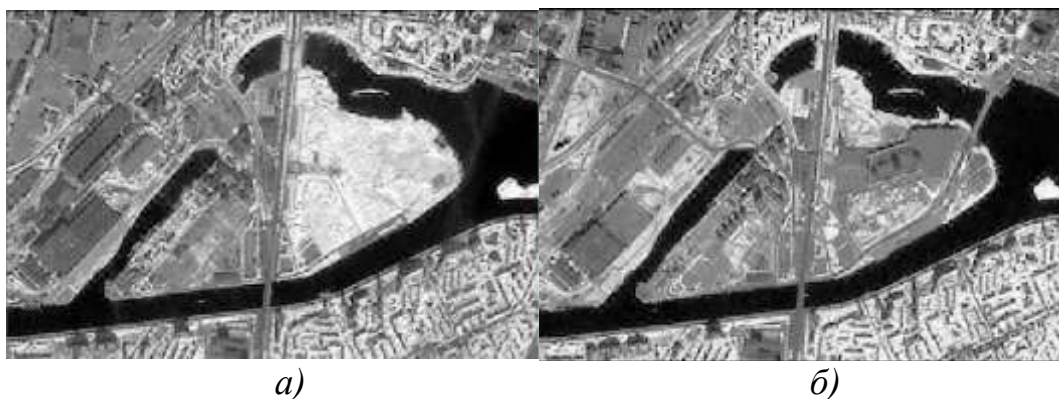
Рис. 3. Индексные разновременные изображения: а) 18.09.2015; б) 28.08.2019

В данной работе для выявления произошедших изменений был использован метод, основанный на поэлементном сравнении индексных изображений. Значения яркости каждого пикселя такого изображения определяется путем применения арифметических операций над значениями яркости этого пикселя из разных каналов снимка. Индексные разновременные изображения представлены на рис.3.