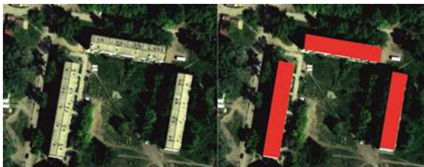
Рис. 5. Результат работы обученной нейронной сети

Результат работы нейронной сети представлен на рисунке 5.