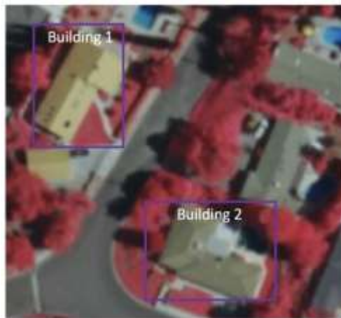
Рис. 1. Нахождения объекта на снимке нейронной сетью SSD

– U-net – позволяет выполнить классификацию каждого пикселя растрового снимка (рис.2);