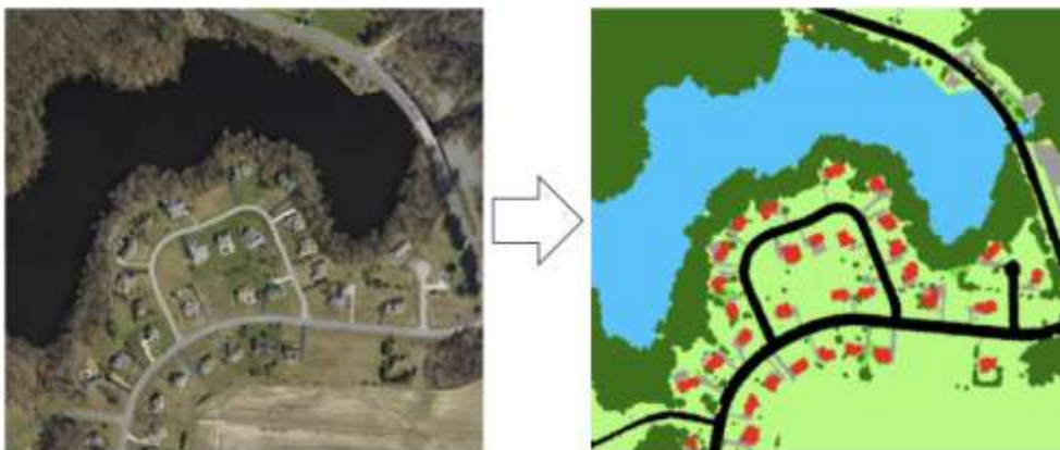
Рис. 2. Результат работы нейронной сети U-net

– U-net – позволяет выполнить классификацию каждого пикселя растрового снимка (рис.2);