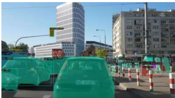
Рис. 3. Сегментация изображения

– MaskRCNN – выполняет поиск объектов на фоне и дополнительно строит для них маски (Рис. 3);