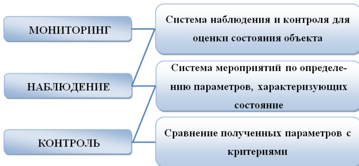
Рис. 2. Система мониторинга

Из данного рисунка можно сделать вывод, что мониторинг – это процесс наблюдения и контроля, которые проводятся на постоянной основе и по определенной системе, служащий для оценки состояния зданий и сооружений, а также происходящих процессов и своевременного выявления причин негативного изменения во всей конструкции, инженерной сети и ее отдельных узлов. В настоящее время мониторинг и обследование зданий регламентируется согласно СП 13 102-2003 «Правила обследования несущих строительных конструкций зданий и сооружений», принятые и рекомендованные к применению в качестве нормативного документа в системе нормативных документов в строительстве постановлением Госстроя России от 21 августа 2003 года №153.