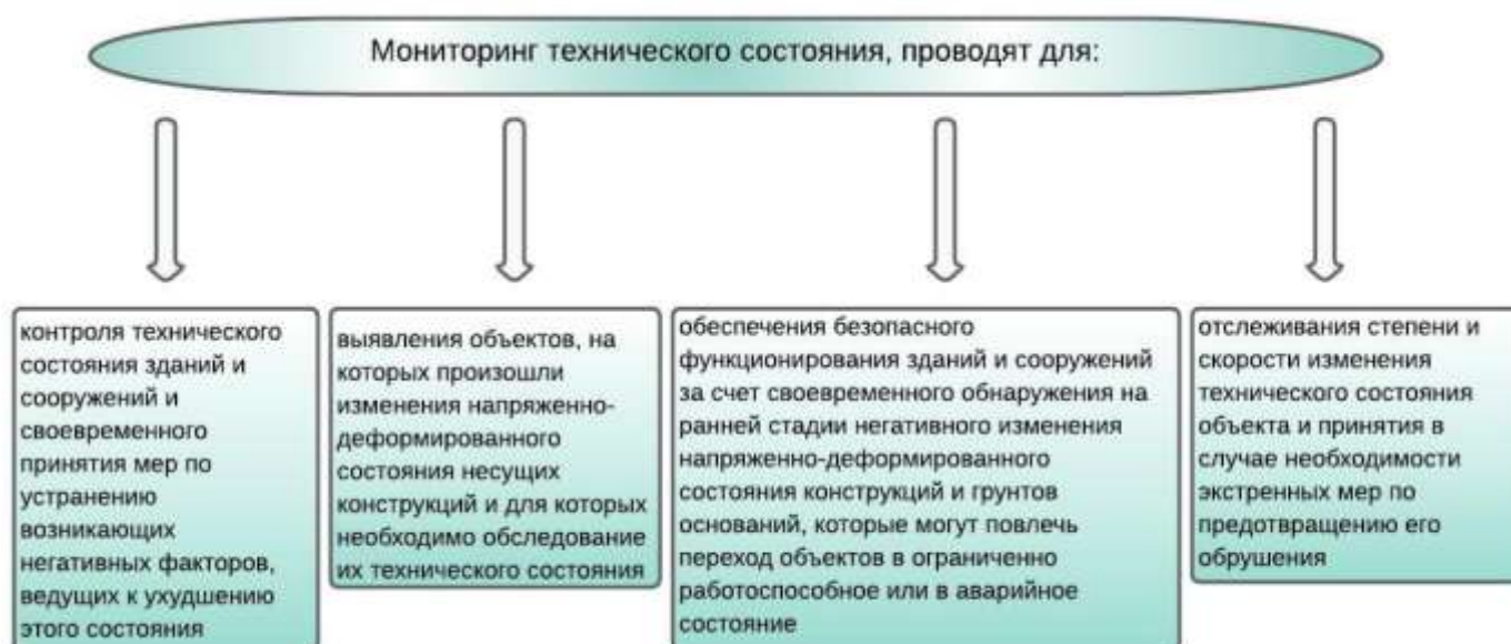
Рис. 1. Цели проведения мониторинга технического состояния

В последнее время в России строится большое количество уникальных зданий и сооружений, которые отличаются интересными конструктивными решениями, строятся из новых материалов и с помощью новых технологий возведения. Под такими зданиями и сооружениями подразумеваются: мосты, туннели, высотные жилые здания, памятники архитектуры и так далее. Но, к сожалению, очень часто строительство таких зданий и сооружений отличается еще и неквалифицированными проектировщиками, строителями и монтажниками. Из-за этого уже после нескольких лет эксплуатации состояние здания начинает ухудшаться и иметь небезопасный характер. Это приводит к необходимости проведения мониторинга технического состояния данных объектов. На рисунке 1 приведены основные цели проведения мониторинга технического состояния.