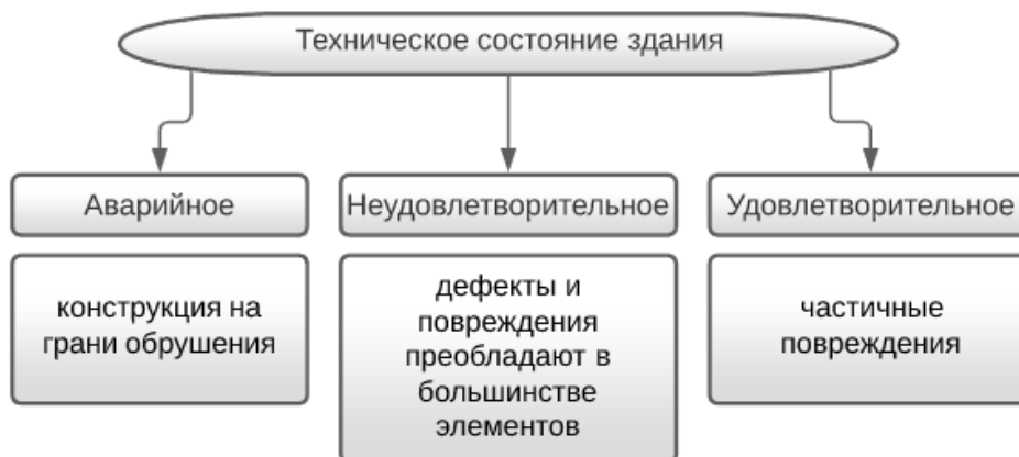
Рис. 5. Техническое состояние здания

Оценка технического состояния здания представлена на рисунке 5.