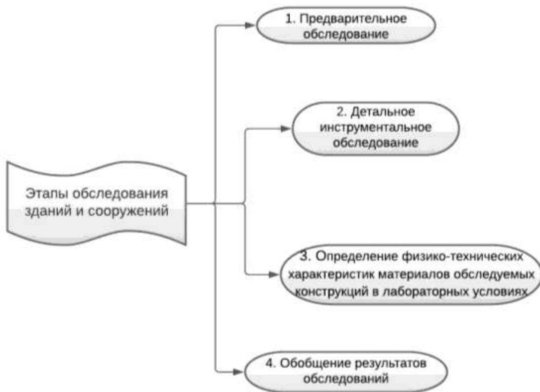
Рис. 3. Этапы проведения мониторинга

Первое обследование технического состояния здания или сооружения происходит максимум через два года после ввода его в эксплуатацию. Далее уже одного раза в 10 лет достаточно. Но если здание или сооружение находится в неблагоприятной зоне, то мониторинг проводят один раз в 5 лет [2].