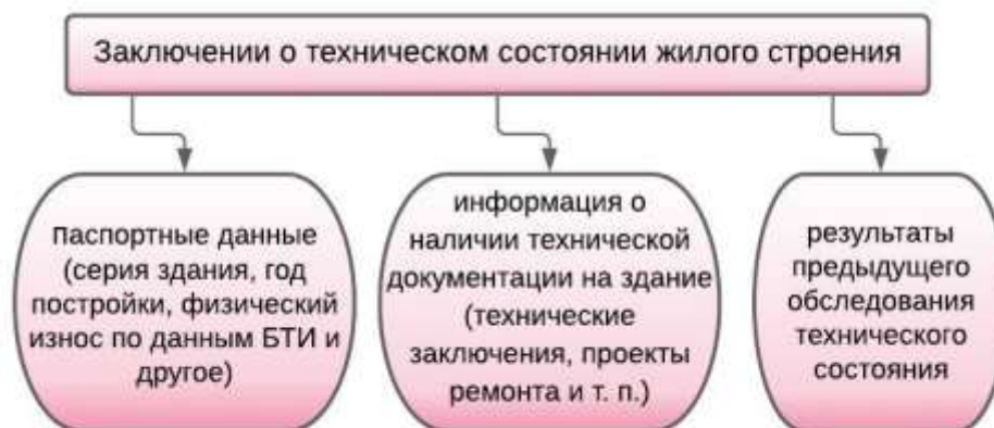
Рис. 6. Заключение о техническом состоянии

Заключением технического состояния жилого объекта являются документы, которые показаны на рисунке 6.