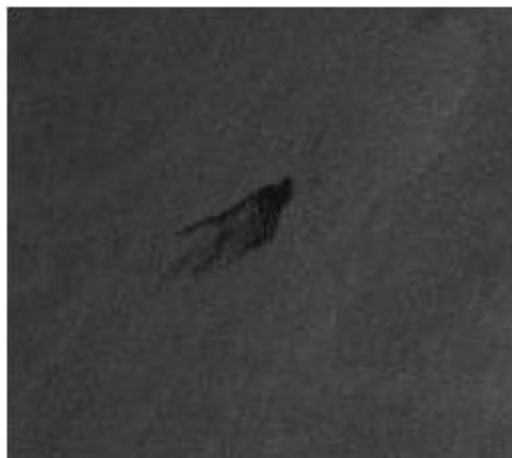
Рис. 1. Фрагмент радиолокационного снимка с изображением нефтяного пятна на водной поверхности

Часто радиолокационные изображения нефтяных пленок на водной поверхности можно спутать с органическими пленками, некоторыми типами льдин, участками, затененными сушей и др. [8-12] При скорости ветра, превышающей 9–10 м/с, нефтяные пленки становятся неотличимы от водной поверхности. [13]