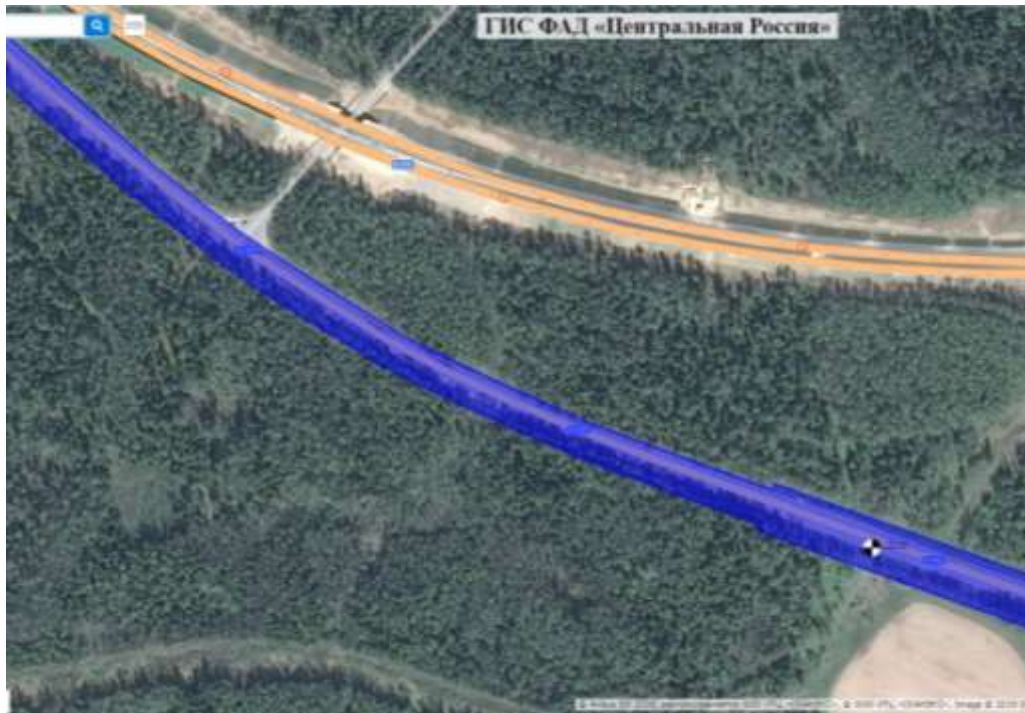
Рисунок 4 – Залесённая полоса отвода участка автомобильной дороги А-107 Московское малое кольцо

С помощью геопортала, владельцы автомобильных дорог могут отслеживать состояние лесных защитных насаждений и принимать решения о необходимости санитарных и лесовосстановительных рубок или высадке насаждений, а также контролировать процесс «залесения» полосы отвода.