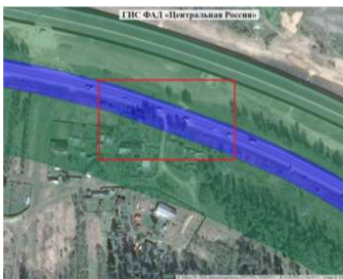
Рисунок 2 – Несанкционированный съезд на участке автомобильной дороги А-107 Московское малое кольцо (км 71+391)

С использованием геопортала и методов визуального и геоинформационного анализа, владельцы автомобильных дорог могут обнаруживать незаконные примыкания (рис.2) и в дальнейшем принять соответствующее решение о ликвидации съезда. Преимуществом данной системы является то, что она разработана на основе API Яндекс.Карт и содержит в себе спутниковые снимки, а также система не перегружена большим количеством информации, что облегчает процесс визуального анализа. [6]