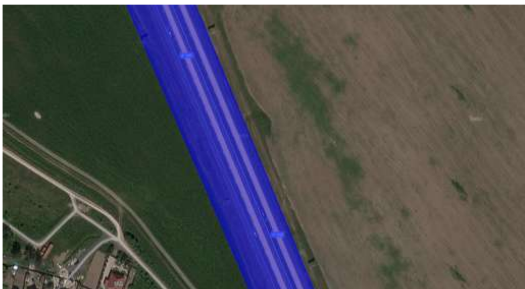
Рисунок 5 – Участок автомобильной дороги А-105 без защитных лесонасаждений