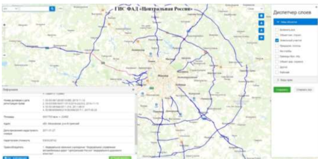
Рисунок 1 – Интерфейс геопортала

Сотрудниками Государственного университета по землеустройству создан геопортал ГИС ФАД «Центральная Россия», содержащий в себе сведения о 14 автомобильных дорогах федерального значения, 30 объектах капитального строительства и более 960 земельных участках. Информация об автомобильных дорогах отображается в векторном (слои: объекты капитального строительства, земельный участок, придорожные полосы, километровые столбы, границы муниципальных образований, объекты дорожного сервиса), текстовом (тип объекта, название дороги, кадастровый номер, вид права, площадь, адрес и др.) и растровом видах (рис.1). Данная система может стать основой для геоинформационного обеспечения мониторинга полос отвода автомобильных дорог. [4,10]