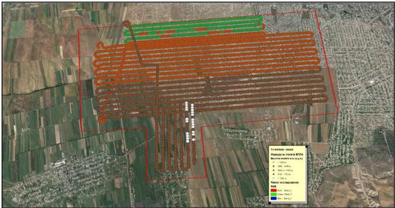
Рисунок 4 – Схема маршрутов полета БПЛА

По результатам формирования накидного монтажа, оцениваются следующие параметры: