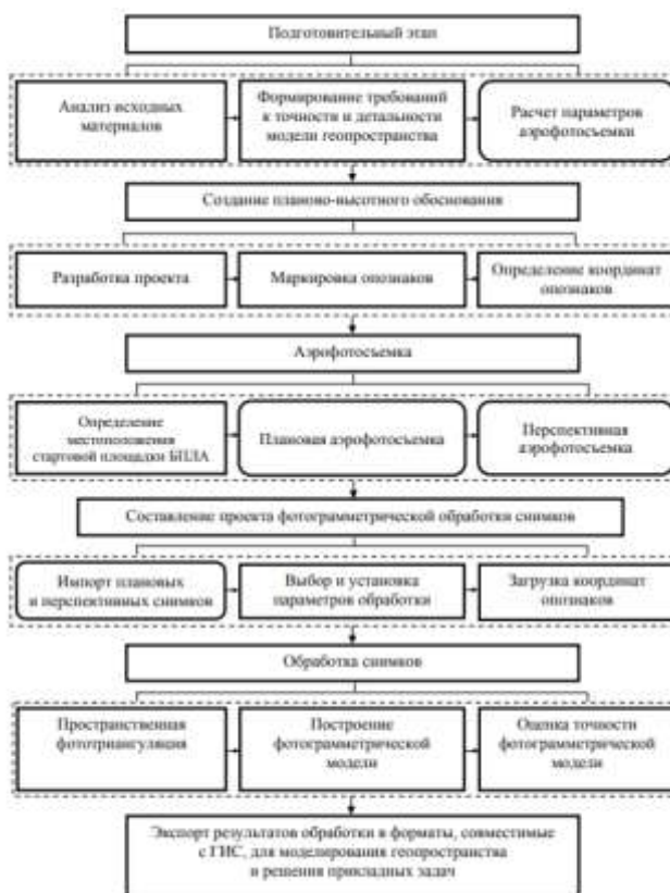
Рисунок 1 – Технологическая схема сбора и обработки данных АФС с использованием БПЛА для моделирования геопространства

В процессе создания 3D-модели для кадастрового учета с использованием БПЛА выделяются основные этапы, представленные на рисунке 1.