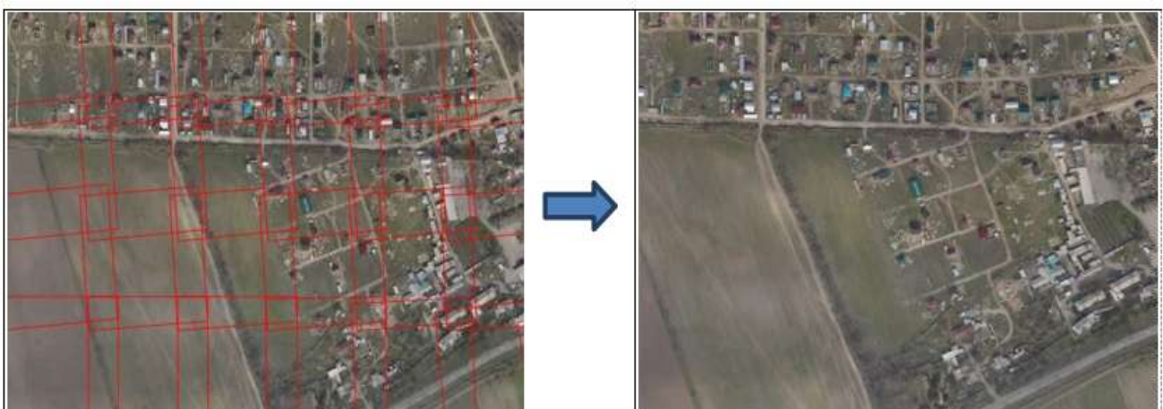
Рисунок 5 – Фрагмент репродукции накидного монтажа

По результатам анализа накидного монтажа дополнительное проведение АФС не потребовалась (рисунок 5).