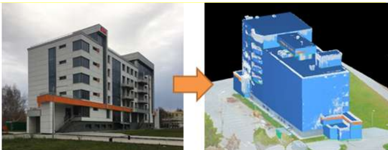
Рисунок 2 – Результаты этапов формирования 3D модели

Результат аэрофотосъемки обрабатывается в специализированном программном обеспечении. В рамках данного исследования обработка проводилась в программе Autodesk Recap для формирования облака точек моделируемого объекта. Параллельно выполнялся этап фототриангуляции, необходимый для координатной привязки 3D-модели здания. После выполнения данных этапов создается пространственная модель здания с необходимыми данными для постановки на трехмерный кадастровый учет [14, 15, 16]. Пример приведен на рисунке 2.