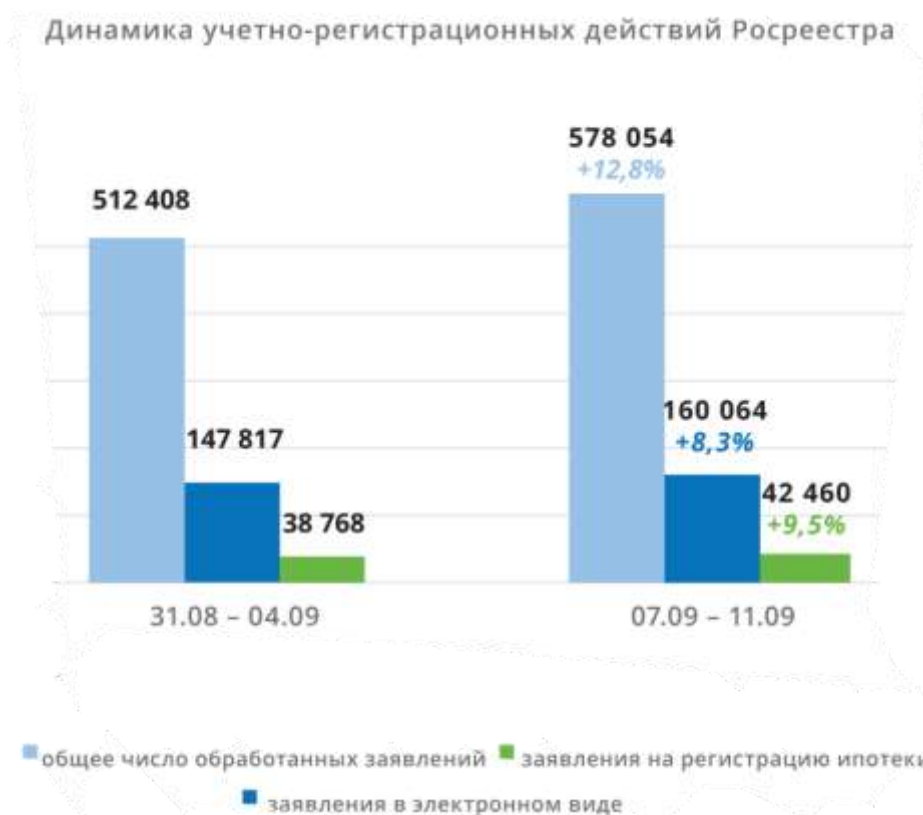
Рисунок 1 – Динамика учётно-регистрационных действий Росреестра на начало сентября 2020 года.

2019 года. При этом электронными сервисами ведомства россияне пользуются активнее, чем в прошлом году.