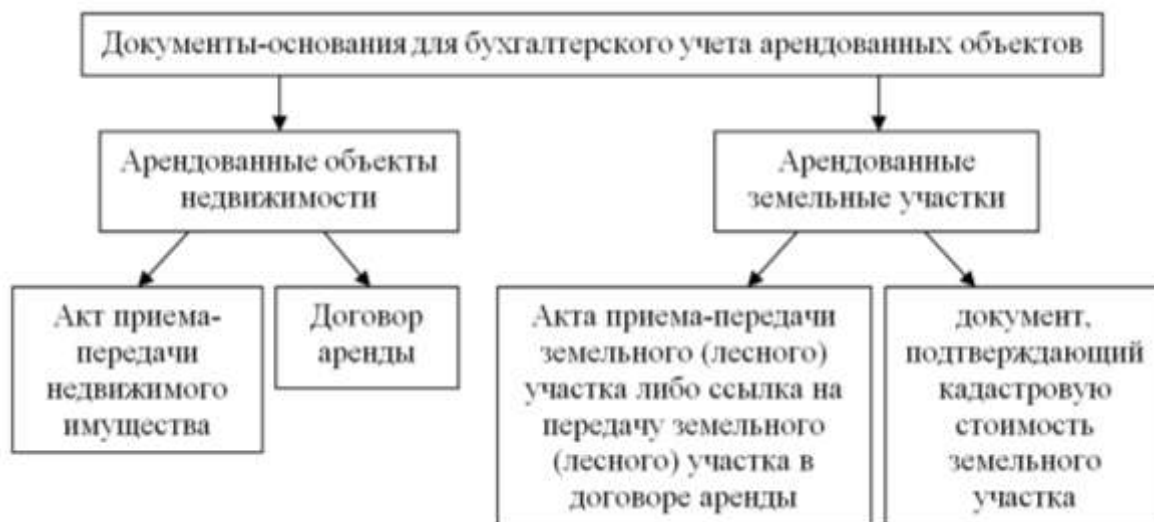
Рис. 4. Документы-основания для бухгалтерского учета арендованных объектов

Арендованные объекты недвижимости, включая земельные участки, отражают в бухгалтерском учете на основании документов, показанных на рисунке 4 [8].