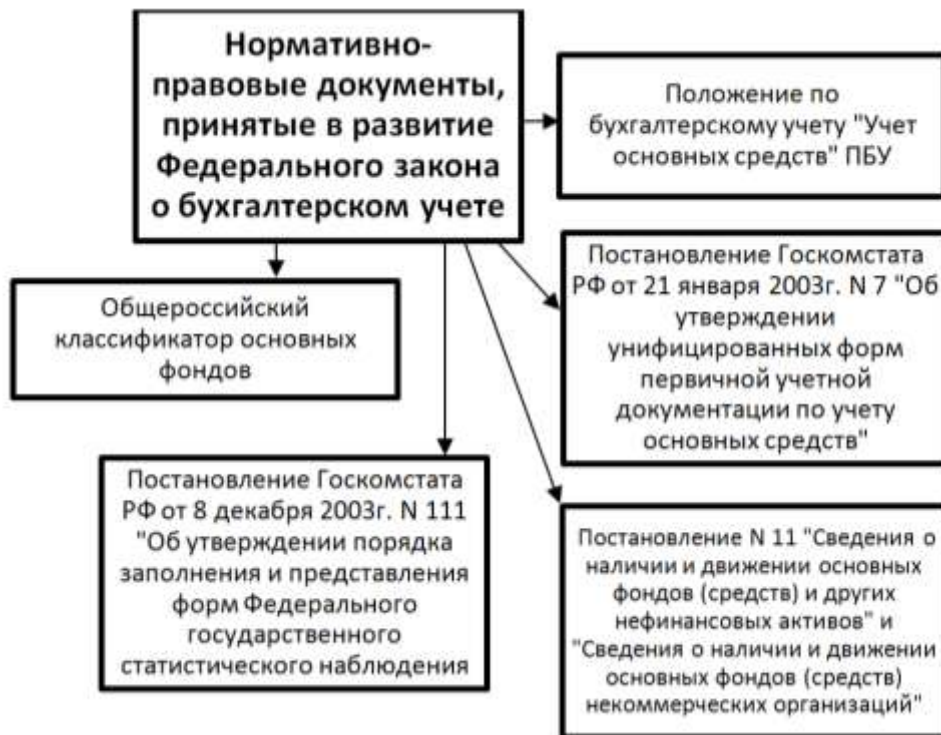
Рис. 2. Нормативно-правовые документы, принятые в развитие Федерального закона о бухгалтерском учете

Существует ряд нормативно-правовых документов, на основании которых осуществляется бухгалтерский учет объектов недвижимого имущества в качестве основных средств. Данные правовые документы указаны на рисунке 2 [4].